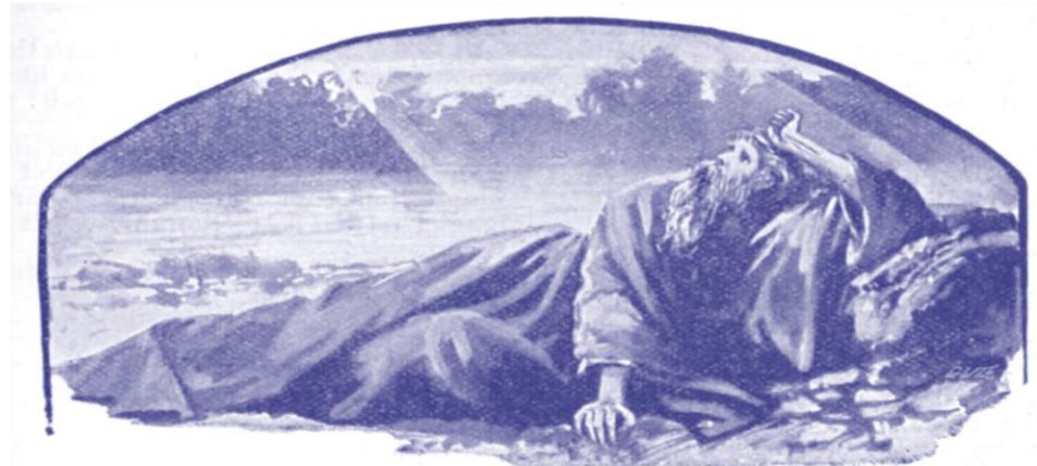
"By the river of Chebar."—Ezek. i. 1.